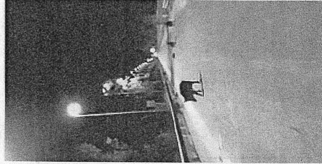
I cinghiali sulle strade

I poliziotti lo hanno denunciato in stato di libertà.